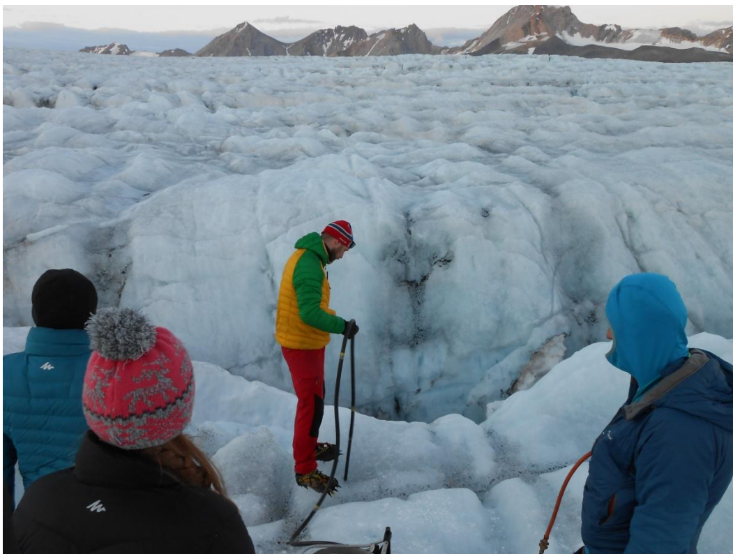
Fot. 2. Prace na Lodowcu Hansa – wytapianie lodu, w celu zamontowania tyczki szczelinomierza.