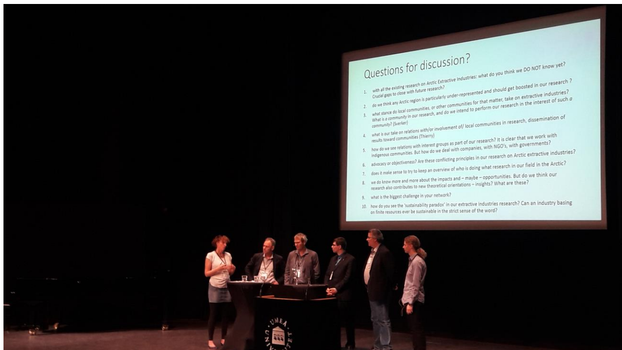
Rysunek 1 Sesja plenarna ICASS

W dniach 8-12 czerwca 2017 w Umea, Szwecja odbył się 9th International Congress of Arctic Social Sciences "People and Places". Jest to jedna z największych konferencji dotyczących Arktyki w kontekście nauk społecznych. W wydarzeniu wzięło udział prawie 700 uczestników, z krajów Europy, a także Kanady, USA, Australii, czy Japonii. Tematy sesji skupione były wokół kwestii rozwoju społeczno-gospodarczego i zarządzania w Arktyce, czy bezpieczeństwa, czy żywności. Znaczna część dyskusji poświęcona była kwestion rdzennej ludności, której przedstawiciele m.in. z Grenlandii i Kanady byli liczni reprezentowani na konferencji.