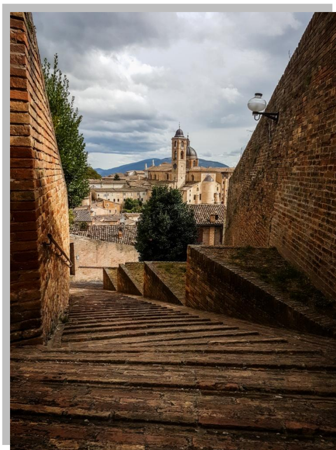
Widok na centrum Urbino wpisane na listę dziedzictwa kulturowego UNESCO