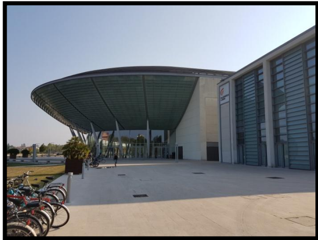
Centrum kongresowe w Rimini, fotografia w środku oraz z zewnątrz