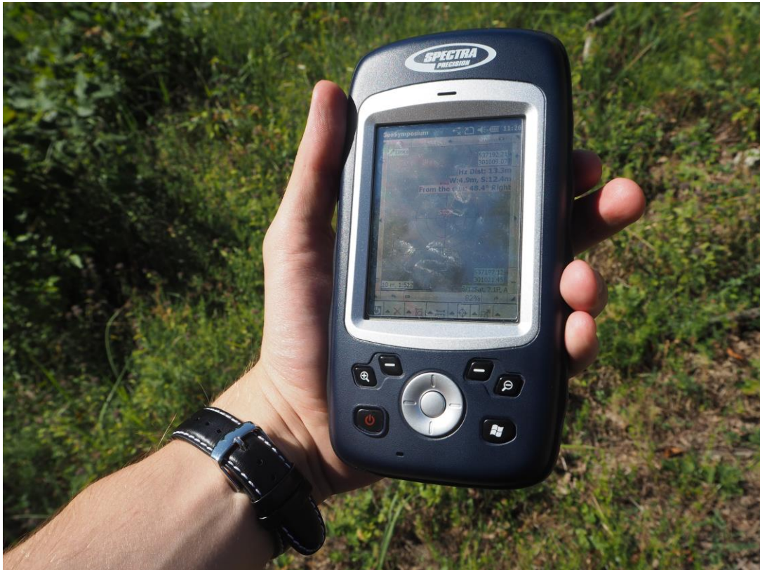
Fot. 1 Urządzenie MobileMapper 20 wykorzystywane do zapisywania lokalizacji punktów pomiarowych w czasie warsztatów terenowych.