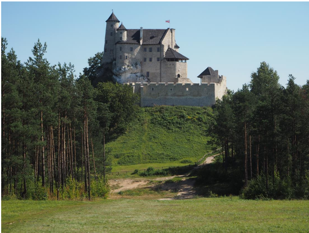
Fot. 2 Zamek Bobolice odwiedzony w trakcie konferencyjnej wycieczki terenowej, wchodził w skład ciągu warowni zwanych „Orlimi Gniazdami” zbudowanych na dawnej granicy polsko-czeskiej. Jako jeden z nielicznych został odbudowany przez prywatnego właściciela.